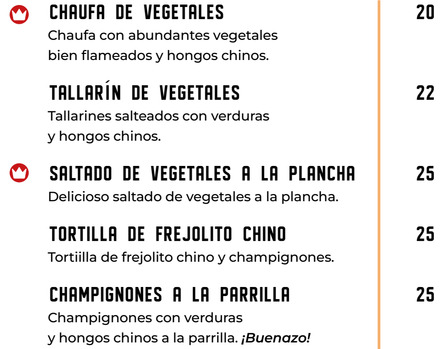
CHAUFA DE VEGETALES