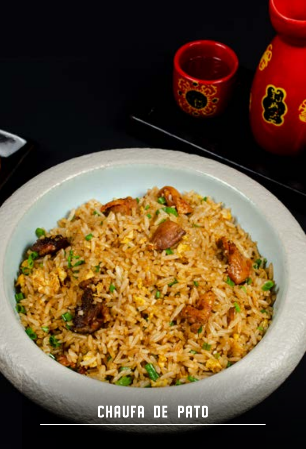
CHAUFA DE PATO