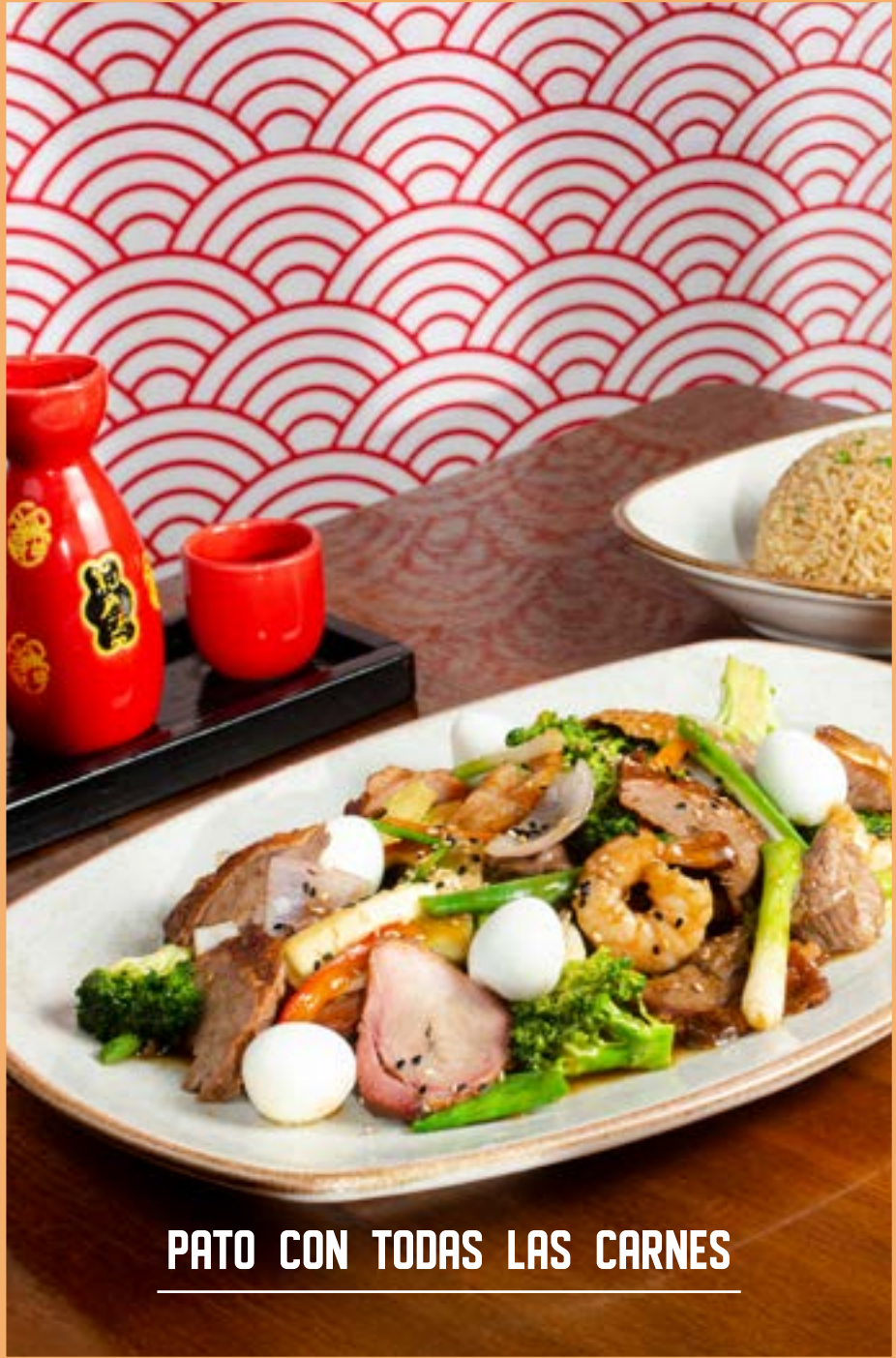
PATO CON TODAS LAS CARNES