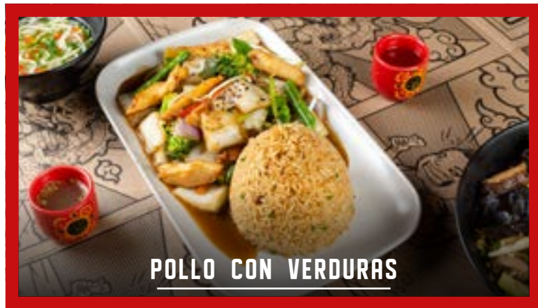
POLLO CON VERDURAS