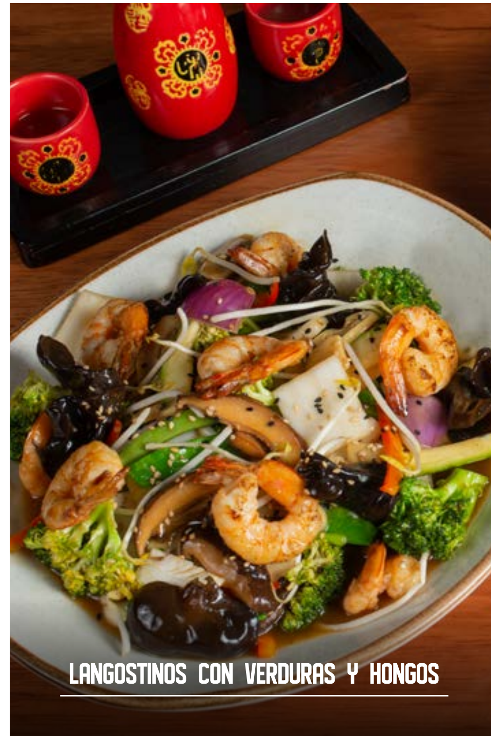
LANGOSTINOS CON VERDURAS Y HONGOS